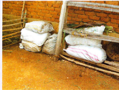
करकट को प्लास्टिक थैली में पैक करना