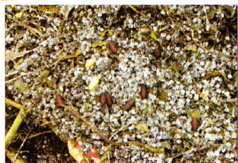
करकट में ऊजी प्यूपा