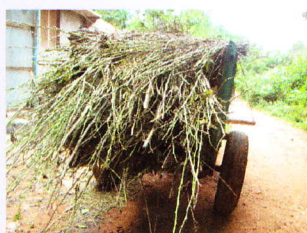
अलग की गई शहत्तू टहनियाँ