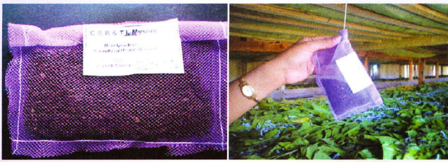
एन टी थैलियाँ और कीटपालन गृह में विमोचन