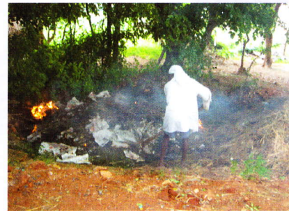
करकट को जलाना

कैरेअप्रसं, मैसूरु में एन.टी. थैलियों की लागत और कुरियर प्रभार का अग्रिम भुगतान प्राप्त होने पर यहाँ से एन.टी. थैलियों की आपूर्ति की जा सकती है।