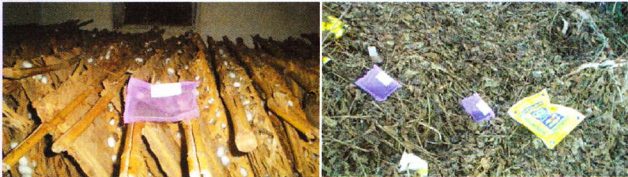
चंद्रिकाओं के पास रखी थैलियाँ