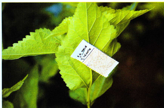
ट्राइको कार्ड लगाना