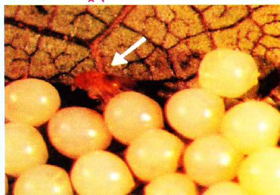
लेपिडोपटरान पीड़क के अंडों को ट्राइको ग्रामा परजीवीकरण